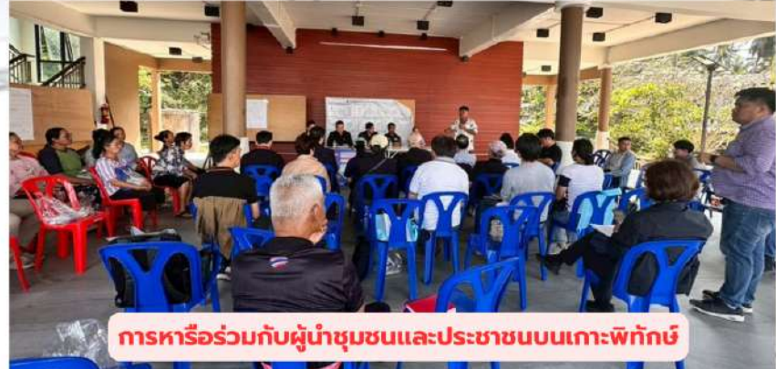
การหารือกับผู้นำชุมชนและประชาชนบนเกาะพิทักษ์