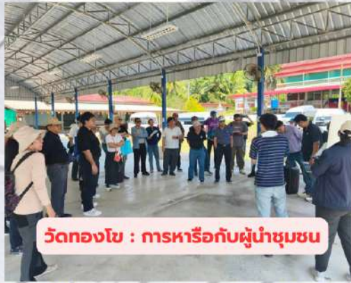
วัดทองโง : การหารือกับผู้นำชุมชน

จากการเข้าร่วมหารือกับผู้นำชุมชน คณะครู/อาจารย์ รวมถึงประชาชนในพื้นที่ศึกษาบ้านน้ำลอด บ้านบางหยี วัดทองโง และชุมชนบน เกาะพิทักษ์ ได้รับทราบว่า ชุมชนมีข้อห่วงกังวลด้านผลกระทบ ต่อทรัพยากรทางทะเล คุณภาพอากาศ การขาดแคลนแหล่งน้ำจืด และการประกอบอาชีพประมง เป็นต้น