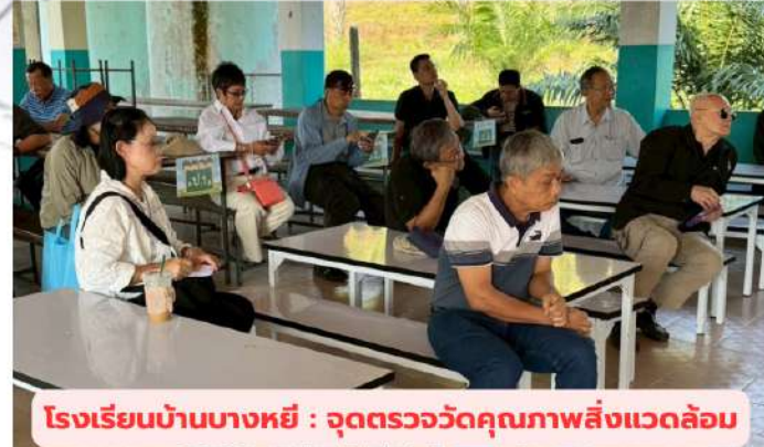
โรงเรียนบ้านบางหยี : จุดตรวจวัดคุณภาพสิ่งแวดล้อม

โดยโครงการพัฒนาท่าเรือแหลมรีวเป็นส่วนหนึ่งของโครงการแลนด์บริดจ์ซึ่งเป็นโครงการขนาดใหญ่ของรัฐที่มีเงินลงทุนสูง มีองค์ประกอบโครงการที่ต้องมีการขุดลอกและถมทะเล การสร้างท่าเทียบเรือ ทางหลวงพิเศษระหว่างเมือง ทางรถไฟ และถนนบริการ ซึ่งเป็นการดำเนินการทั้งบนบกและในทะเล ทั้งฝั่งอ่าวไทยและอันดามัน ทำให้เกิดการสูญเสียทรัพยากร และการเวนคืนอสังหาริมทรัพย์ ทั้งนี้ สผ. จะนำประเด็นข้อห่วงกังวลและข้อมูลที่ได้รับจากการตรวจสอบพื้นที่ ไปประกอบการพิจารณารายงานการประเมินผลกระทบสิ่งแวดล้อม (EHIA) ต่อไป