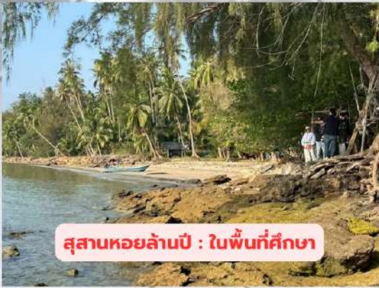
สุสานหอยล้านปี : ในพื้นที่ศึกษา