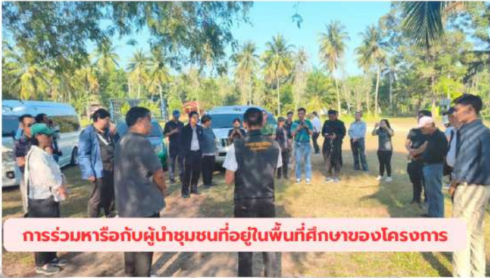
การร่วมหารือกับผู้นำชุมชนที่อยู่ในพื้นที่ศึกษาของโครงการ

เมื่อวันที่ 24-26 กุมภาพันธ์ 2569 เจ้าหน้าที่สำนักงานนโยบายและแผนทรัพยากรธรรมชาติและสิ่งแวดล้อม (สผ.) พร้อมด้วยคณะกรรมการผู้ชำนาญการพิจารณารายงานการประเมินผลกระทบสิ่งแวดล้อม โครงการโครงสร้างพื้นฐานทางน้ำ และผู้ทรงคุณวุฒิด้านนิเวศทางน้ำ ได้ลงพื้นที่ร่วมกับเจ้าหน้าที่สำนักงานนโยบายและแผนการขนส่งและจราจร (สนข.) และบริษัทที่ปรึกษาโครงการฯ เพื่อตรวจสอบพื้นที่และสำรวจสภาพแวดล้อมโดยรอบของโครงการพัฒนาท่าเรือบริเวณแหลมรีว รวมทั้งได้ร่วมหารือกับผู้นำชุมชนและประชาชนในพื้นที่ศึกษา และประชาชนบนเกาะพิทักษ์